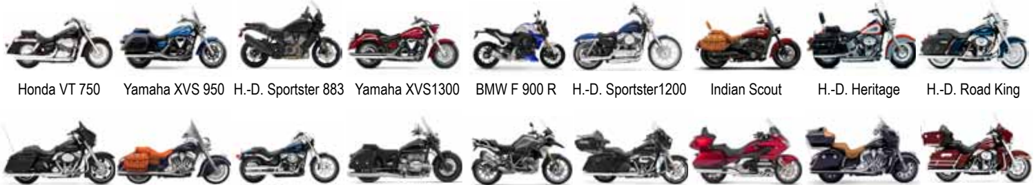
Honda VT 750 Yamaha XVS 950 H.-D. Sportster 883 Yamaha XVS1300 BMW F 900 R H.-D. Sportster1200 Indian Scout H.-D. Heritage H.-D. Road King