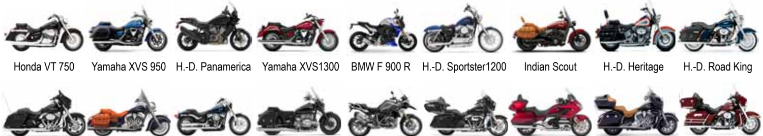
Honda VT 750 Yamaha XVS 950 H.-D. Panamerica Yamaha XVS1300 BMW F 900 R H.-D. Sportster1200 Indian Scout H.-D. Heritage H.-D. Road King