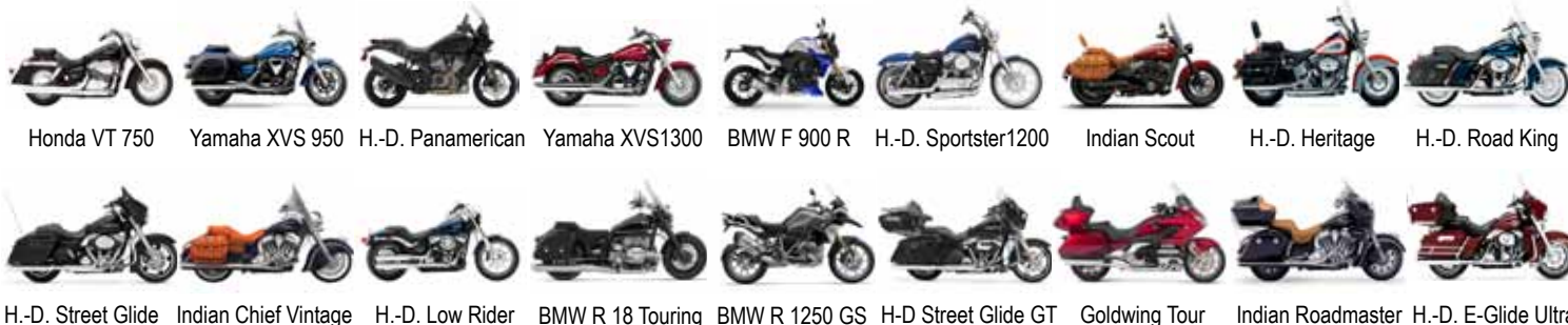
Honda VT 750 Yamaha XVS 950 H.-D. Panamerican Yamaha XVS1300 BMW F 900 R H.-D. Sportster1200 Indian Scout H.-D. Heritage H.-D. Road King