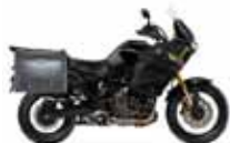
Yamaha Super Ténéré