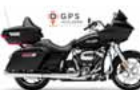
H-D. Road Glide G. T.