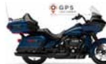
H-D. Road Glide Ultra