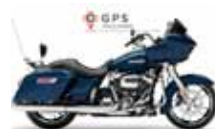
H-D. Road Glide