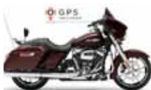
H-D. Street Glide