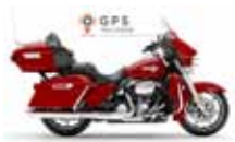
H-D. Electra Glide