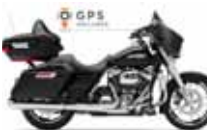
H-D. Street Glide G. T.