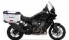
H-D. Pan America