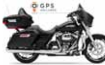
H-D. Street Glide G. T.