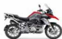
BMW R 1250 GS