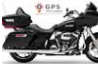
H-D. Road Glide G. T.