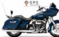
H-D. Road Glide