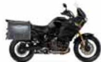
Yamaha Super Ténéré