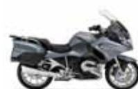
BMW R 1250 RT