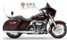
H-D. Street Glide