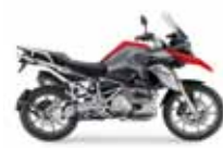
BMW R 1250 GS