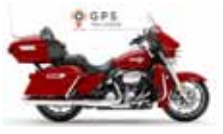
H-D. Electra Glide