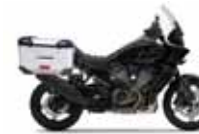
H-D. Pan American