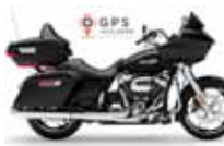
H-D. Road Glide Ultra