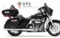
H-D. Street Glide G. T.