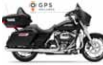
H-D. Street Glide G. T.